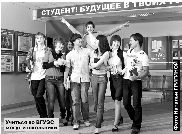
Учиться во ВГУЭС могут и школьники